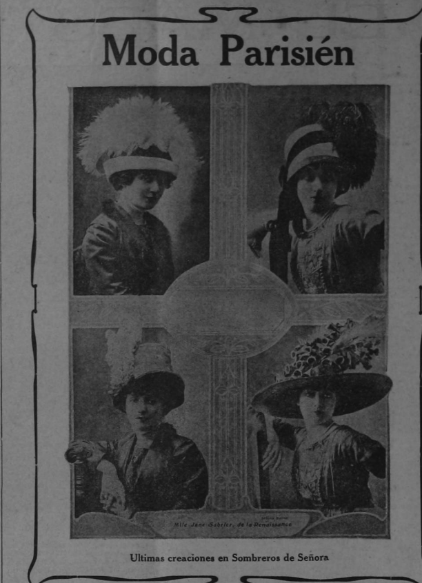
Últimas creaciones en Sombreros de Señora

El comercio no ha echado raíces, pues su aparición data de días, y años hace que este amargo fruto de la anarquía desapareció del país. El Norte y centro de la República, con sus montañas, por los peligrosos que sabrán extinguir en breves semanas. Para eso se cuenta con el ejército y con las tropas creadas por la revolución. Las elecciones para la renovación del Ejecutivo se verificarán en noviembre entrante. Al sentimiento actual está por la paz y todo parece encaminado á ese fin.